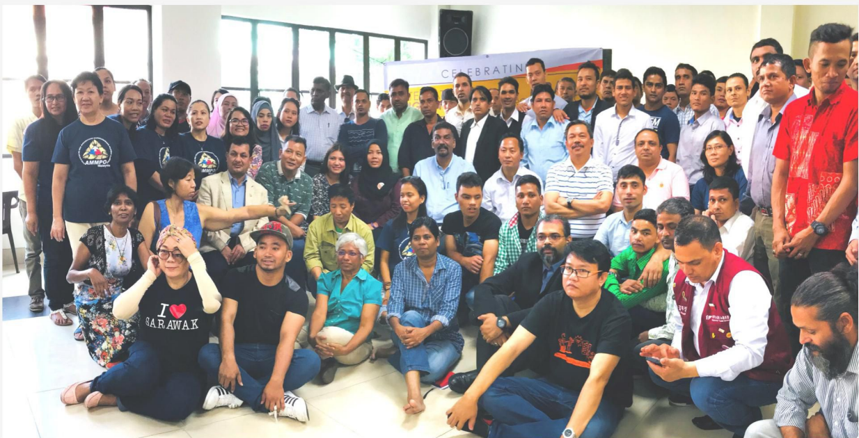
A group photo at the end of the function held in Kuala Lumpur on 17 December 2017.