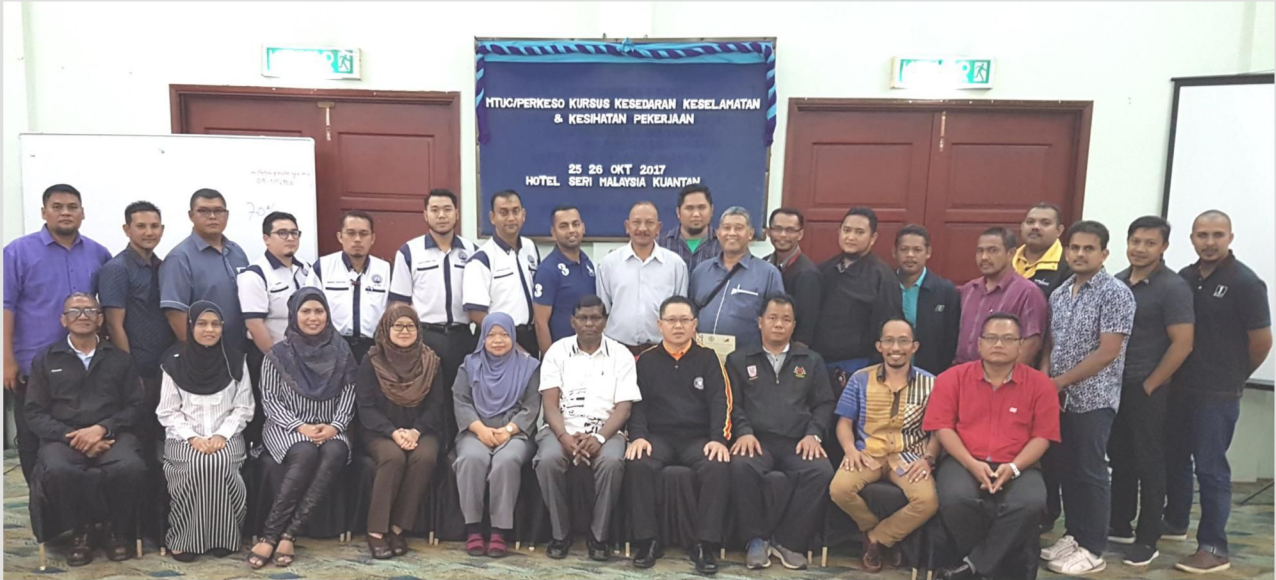
Kursus Latihan Keselamatan dan Kesihatan Pekerja yang diadakan di Kuantan, Pahang pada 25 dan 26 Oktober 2017.