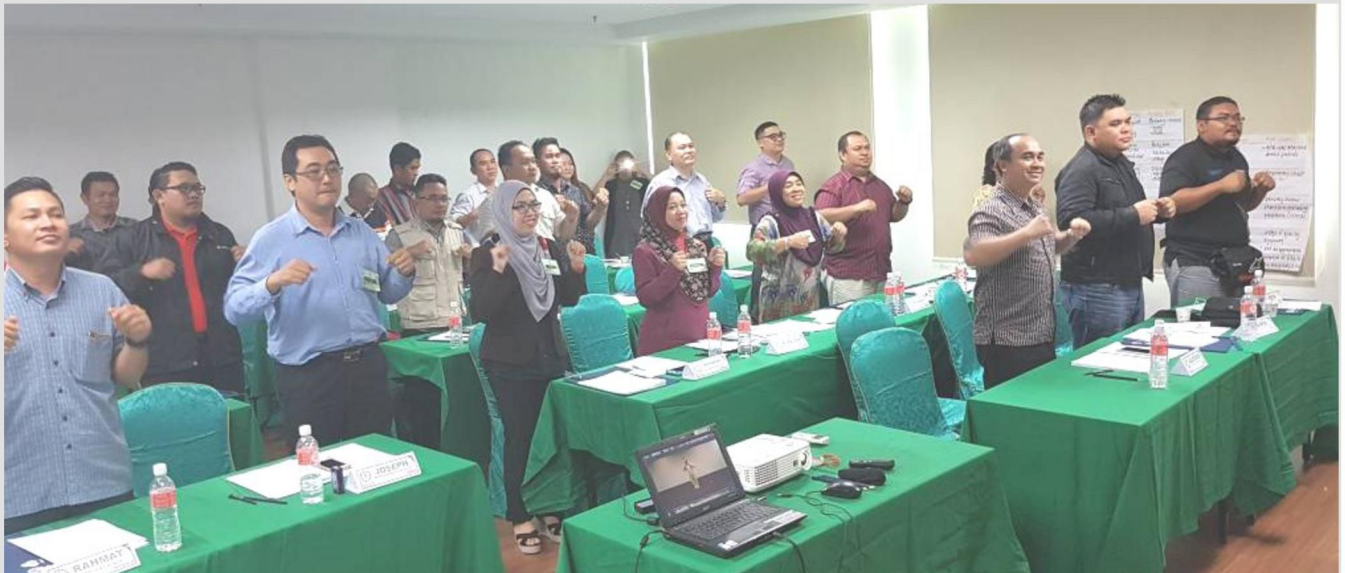
Peserta mengikuti Kursus Keselamatan dan Kesihatan Pekerja di Lundu, Sarawak pada 9 dan 10 Oktober. 2017.