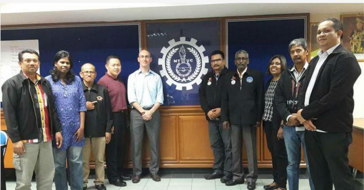
Sebahagian daripada mereka yang mengikuti Latihan Pemantauan dan Penilaian bagi MRC MTUC.