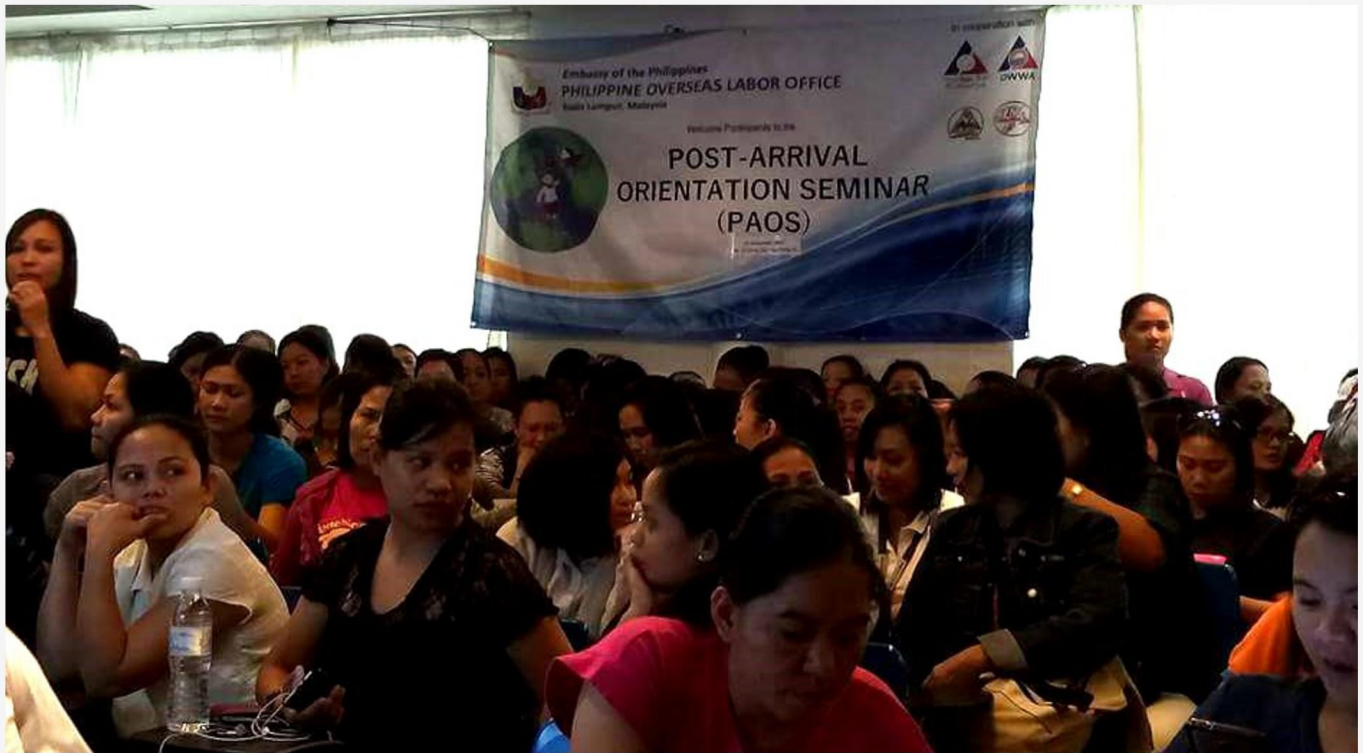
Those attended the Post Arrival Orientation Seminar (PAOS) in Kuala Lumpur.