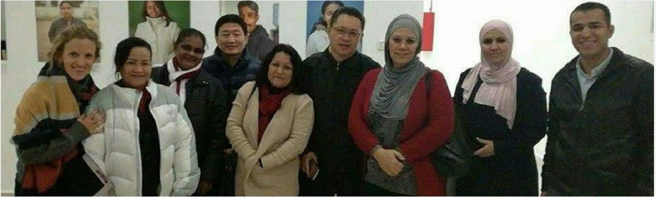
Participants of the Multi-Stakeholder Meeting held in Amman, Jordan.

JORDAN: The Multi-Stakeholder Meeting on Empowering and Organizing Migrant Workers was held in Amman, Jordan.