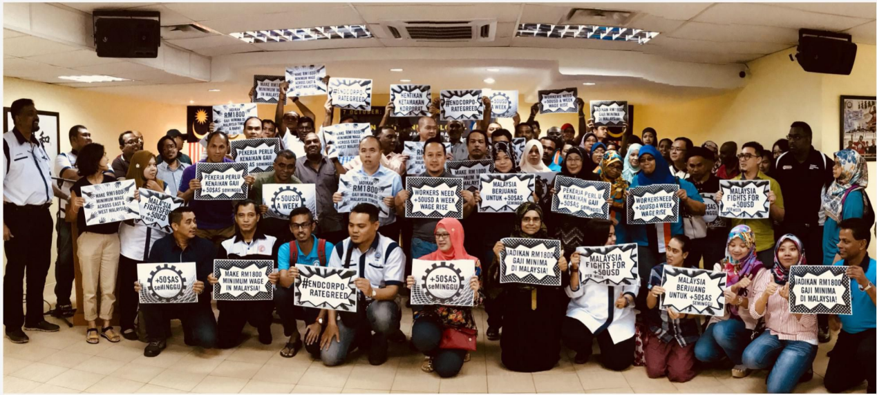
Hadirin yang menjayakan Kempen Gaji Minima Global di NUBE House pada Oktober 2017.

Melalui Perintah Gaji Minimum 2016, kadar gaji minimum ditetapkan mengikut wilayah iaitu RM1,000 sebulan atau RM4.81 sejam bagi Semenanjung Malaysia dan RM920 sebulan atau RM4.42 sejam bagi Sabah, Sarawak dan Labuan.