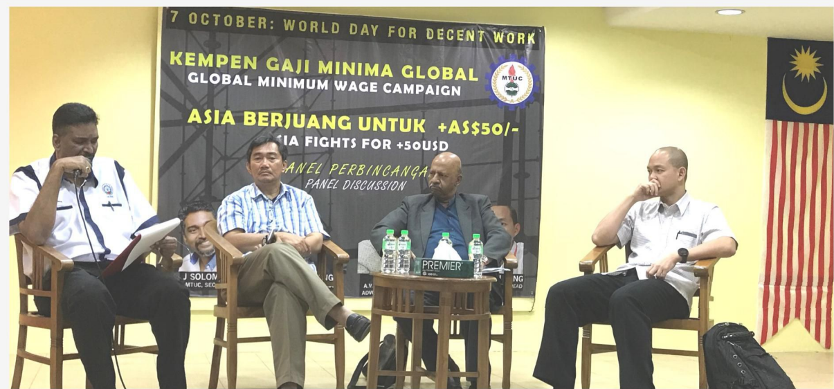
Ahli panel mengupas tajuk Kempen Gaji Minima Global di NUBE House pada Oktober 2017.

KUALA LUMPUR: Kongres Kesatuan Sekerja Malaysia (KKSM) mahu gaji minimum yang diperkenalkan pada tahun 2012 dinaikkan kepada RM1,800 dengan mengambil kira kos sara hidup yang semakin meningkat.