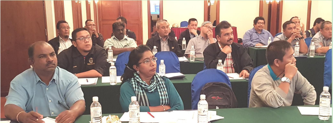
Kursus Keselamatan dan Kesihatan Pekerja yang berlangsung di Kuala Lumpur pada 18 dan 19 September 2017.