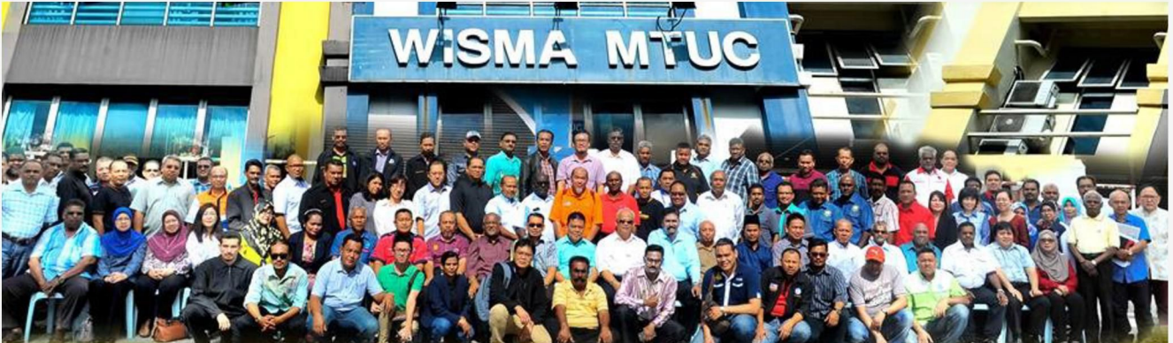
Barisan kepimpinan KKSM bergambar kenang-kenangan selepas mesyuarat pertama Majlis Am awal tahun ini.

Saya berharap kita dapat mengubah situasi ini. Kita dapat melakukan yang terbaik bagi kaum pekerja — sebagai satu pasukan yang bersatu padu, kita boleh menang dan berjaya dalam perjuangan mendapatkan keadilan. Kita boleh berada di garis depan perjuangan untuk melihat kesaksamaan, hak asasi manusia dikotakan dan kesatuan sekerja, kebebasan bersuara dan berpersatuan, hak-hak wanita, perlindungan pengguna dan alam sekitar dan pembaharuan ekonomi dan keadilan sosial untuk semua termasuk pekerja-pekerja asing. Kesatuan sekerja perlu menjadi watak utama dalam keterlibatan dan penyertaan yang menyeluruh dalam setiap aktiviti KKSM. Saya berharap kita akan dapat menjadikan KKSM satu badan induk dihormati demi memulihkan "maruah pekerja".