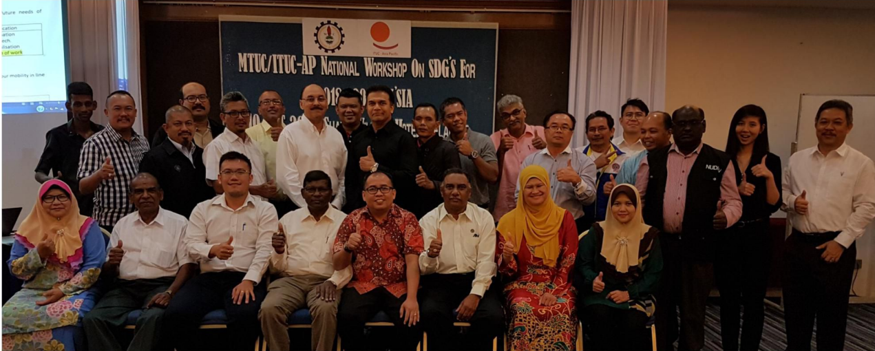
MTUC/ITUC-AP National Workshop on SDG's For 2018-2020 Malaysia was held from 9-10 2017 in Petaling Jaya, Selangor.