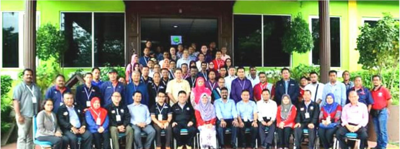
Para peserta yang mengikuti kursus di Melaka pada 30 Oktober.

SUBANG JAYA: Ibu Pejabat Kongres Kesatuan Sekerja Malaysia (KKSM) meneruskan program meningkatkan kesedaran mengenai soal keselamatan dan kesihatan pekerjaan di seluruh negara.