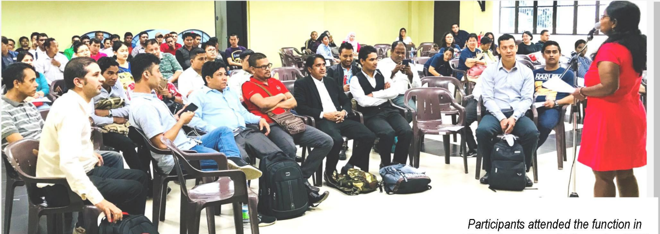
Participants attended the function in Kuala Lumpur on 17 December 2017.