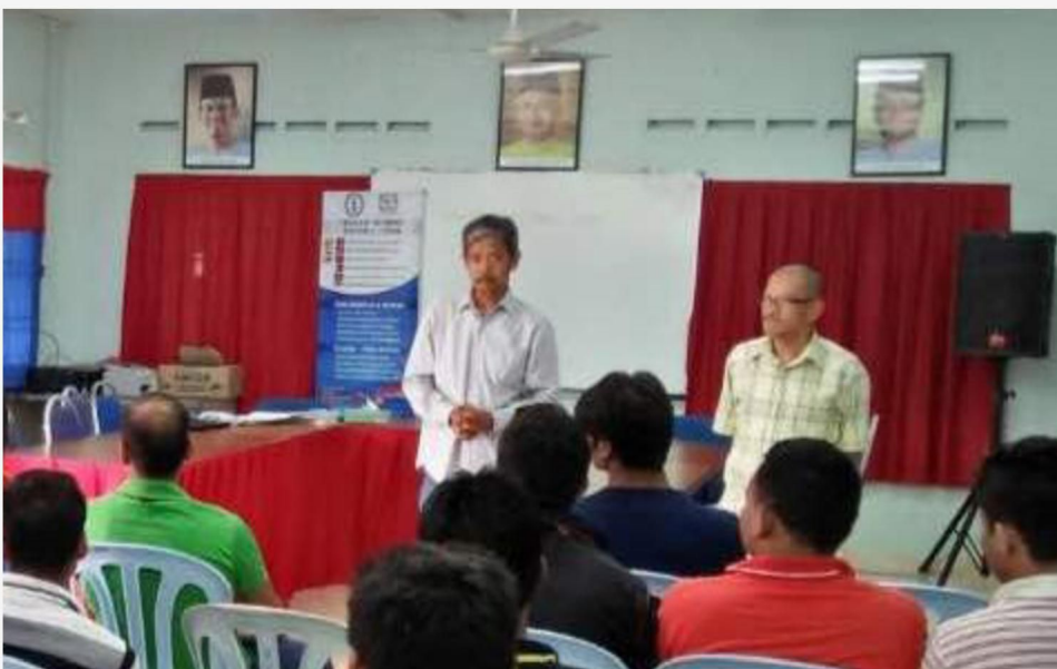
MRC MTUC conducting one-day training at Kluang.

KLUANG: Malaysian Trades Union Congress (MTUC) organised training session on 18 December 2017 here for migrant workers from Nepal and Bangladesh.