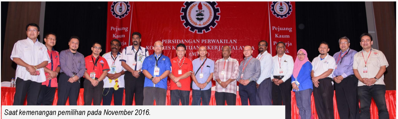
Saat kemenangan pemilihan pada November 2016.

KONGRES Kesatuan Sekerja Malaysia (KKSM) ditubuhkan pada tahun 1949 dengan objektif untuk melakukan segala-galanya untuk mempromosi kepentingan anggota gabungan atau apa juga manfaat demi kepentingan pekerja ketika itu, pada hari ini dan untuk melahirkan pekerja-pekerja relevan di dunia pada masa depan. Sejak itu, di antara pencapaian yang lain, kita pernah memiliki pemimpin-pemimpin unggul yang telah memimpin pekerja di dalam dan luar negara dalam mencapai matlamat kita, penyertaan awam, menyuarakan aspirasi pekerja Malaysia yang pelbagai. upah minimum, lanjutan umur persaraan dan banyak lagi perlindungan sosial yang diperlukan.