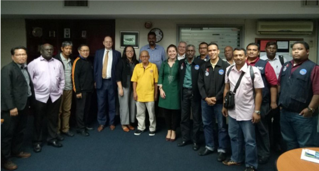
Group photo session at the end of the visit by ILO Geneva..

SUBANG JAYA: On the 7th December 2017, the International Labour Organization (ILO) Geneva and Kuala Lumpur had visited the Malaysian Trades Union Congress office.