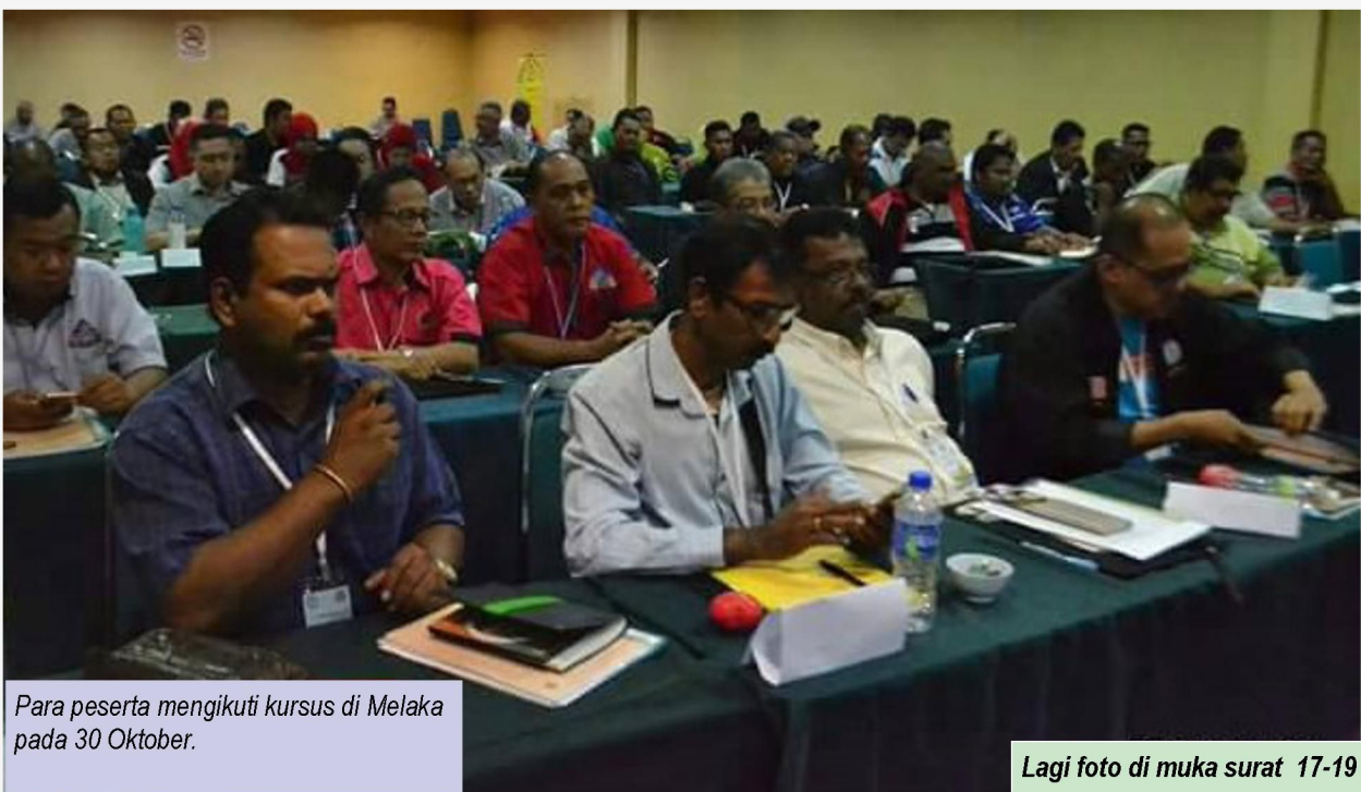
Para peserta mengikuti kursus di Melaka pada 30 Oktober.

Kursus peringkat nasional telah diadakan di Melaka pada 30 Oktober.