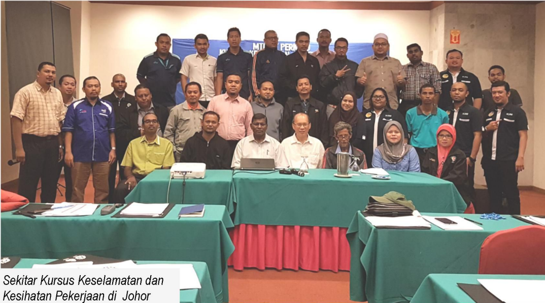
Sekitar Kursus Keselamatan dan Kesihatan Pekerja di Johor Bahru, yang berlangsung pada 13 dan 14 November 2017.