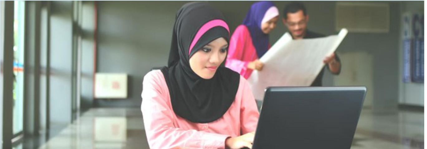
Isu beberapa majikan hotel melarang pemakaian tudung menjadi perhatian baru-baru ini.—Gambar hiasan