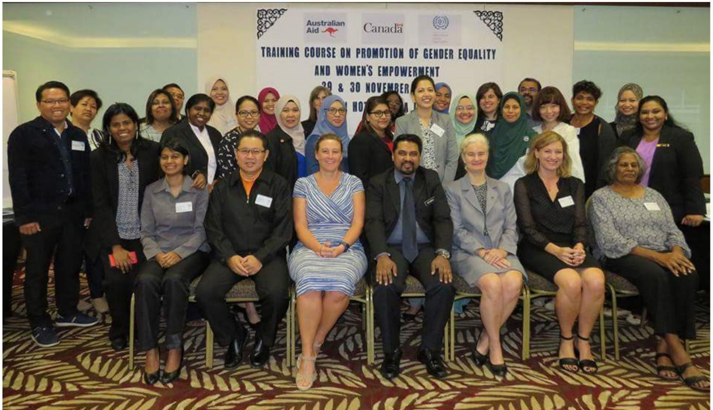
Participants of Training Course on Promotion of Gender Equality and Women's Empowerment.