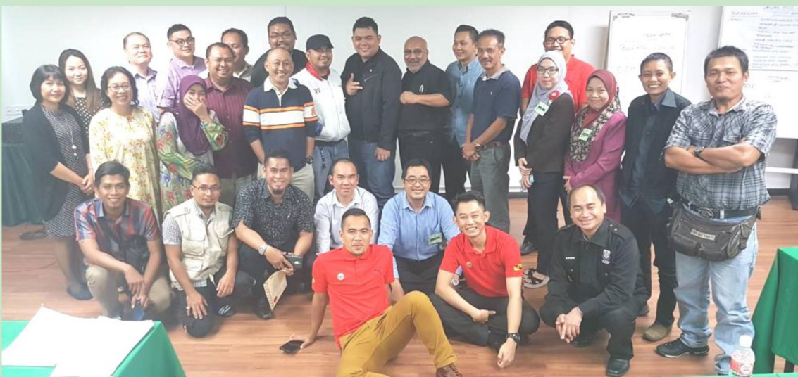
Mereka yang menyertai Bengkel Keselamatan dan Kesihatan Pekerjaan di Sibul pada 2 dan 3 Oktober 2017.