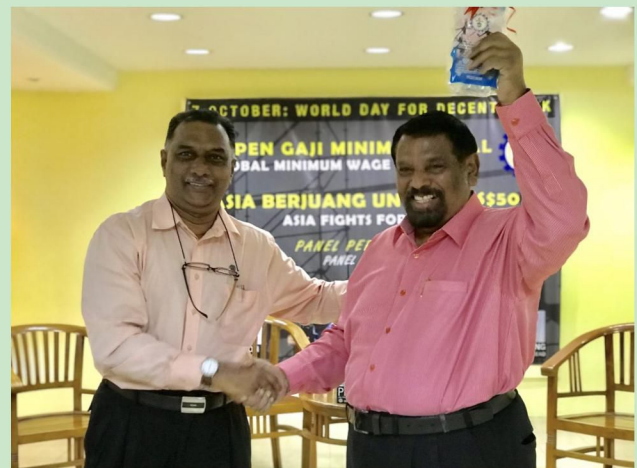
Sesi penyampaian cenderahati kepada tetamu jemputan khas.